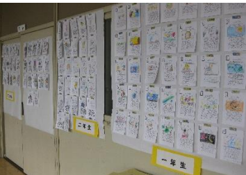
「読書郵便」「おすすめ本の紹介」「ブラックライトシアター」