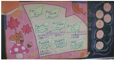
昔語りの会「あかり」による語り